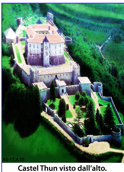
Castel Thun visto dall'alto.

Saluteremo il Trentino visitando Castel Thun , splendido esempio di castello-residenza, da poco restituito alla fruizione del pubblico.